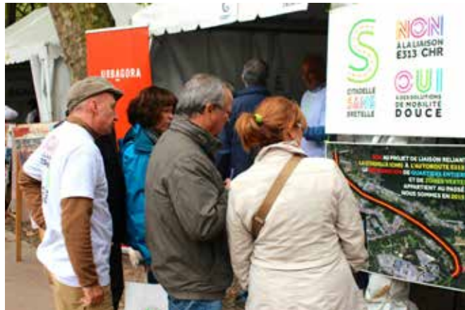
Participation au rassemblement associatif «Retrouvailles» en septembre 2015