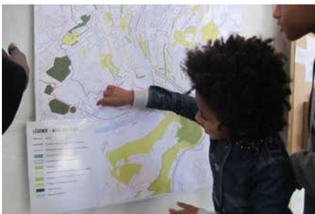
Atelier de cartographie participative du maillage vert, automne 2015

urbAgora ASBL Rue Saint-Denis 10 B - 4000 Liège