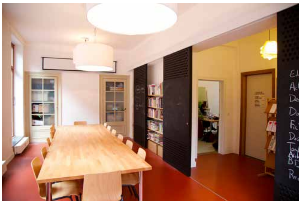
Salle de réunion de l'asbl

Les groupes de travail constituent le cœur de la production de fond de l'association. Chacun traite d'une thématique particulière et son activité est très variable selon l'actualité, la méthode de travail choisie par ses membres et le niveau d'implication de ceux-ci. La plupart de ces groupes bénéficient d'un soutien de la part du staff permanent.