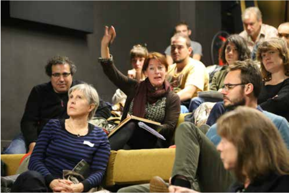
Rencontre des Luttes urbaines, 7 novembre 2015