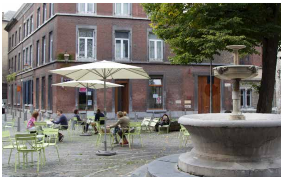
Bureaux d'urbAgora, Place Saint-Denis

Si pendant plusieurs années, la vie de l'association a reposé exclusivement sur ses bénévoles, urbAgora est désormais reconnue comme Association d'Éducation permanente par la Communauté française (axe 3.2). Cette reconnaissance lui apporte la plus grande partie de ses ressources financières. S'ajoutent un soutien de la Région wallonne (à travers des points APE) et un petit subside de la Ville de Liège.