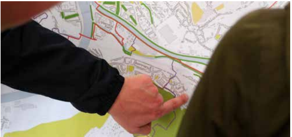
Atelier de cartographie participative du maillage vert, automne 2015

Citons encore l'existence des GT Espace Public, Commerce ainsi que le GT Transports en commun dont les actions ont été plus discrètes en cette année 2015 mais dont les réflexions sont tout de même en train de porter leurs fruits.