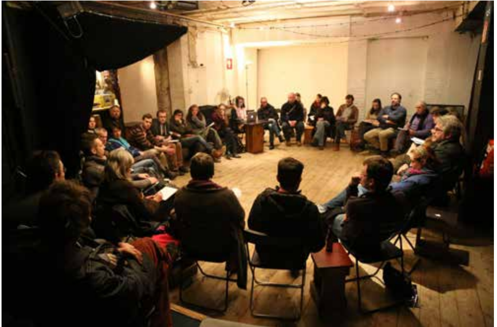
Café urbain du 3 février 2015, «Quelle place pour le maraîchage urbain à Liège?», à l'An Vert