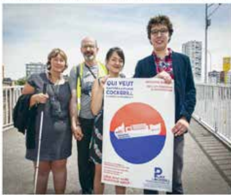
Place Cockerill a vu notamment que la rampe d'accès à la passerelle ne soit pas supprimée au profit d'un escalier.

souterrain de 400 emplacements sous la place Cockerill et le stationnement des espaces publics en surface, depuis la rue de l'Étoile jusqu'à Quai sur Meuse. Pour ce projet, les deux accès aux parkings souterrains nécessitent deux voies trois bandes de circulation. C'est ainsi qu'un pied de la passerelle, un espace large de six bandes de circulation réduit les espaces publics et entraîne la suppression de la rampe d'accès à la passerelle au profit d'un escalier de 24 marches. Les cyclistes et PMR venant d'Outremeuse devraient dès lors emprunter une nouvelle rampe d'accès de 8 % de déclivité dont la largeur est réduite de moitié et un autre de 50°. Etant donné qu'il faudrait traverser à deux reprises trois bandes de circulation pour rejoindre le rest de la Région qui mène au centre-ville. « C'est un investissement nul par rapport à la situation actuelle pour une voie qui se prêtait déjà en matière de politique cy-